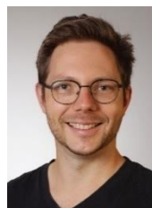
Physiotherapeut stellv. Schulleitung